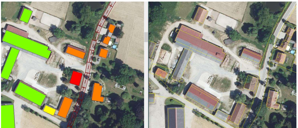
Abbildung 7. Darstellung der betroffenen Gebäude für den Bereich Büchling.

S:\MIP\proj\175\M175459\M175459_07_Ber_2D.DOCX:16. 02. 2024