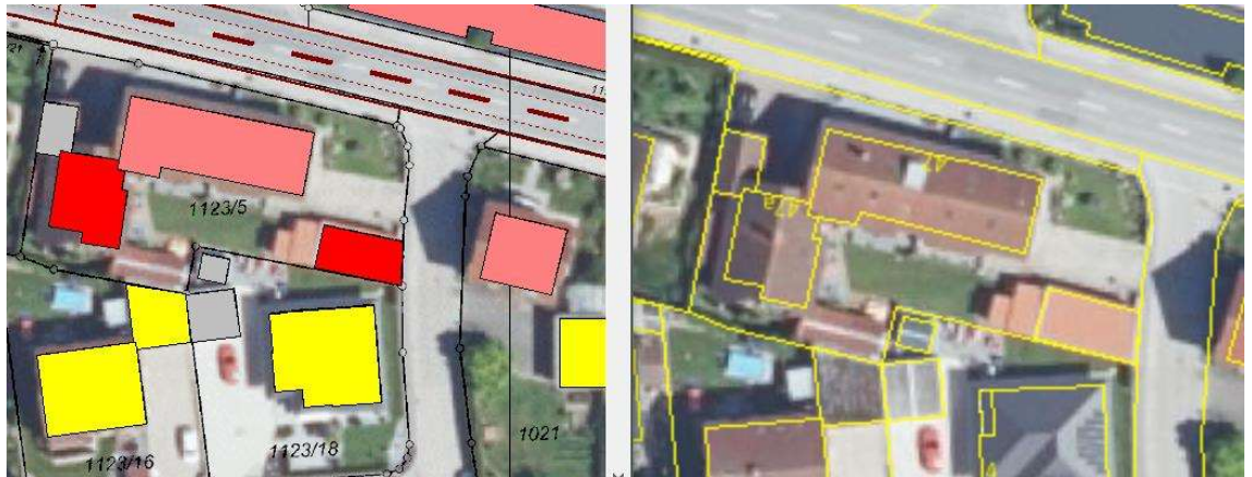
Abbildung 10. Darstellung der betroffenen potenziellen Außenwohnbereiche für den Bereich Starubinger Straße 47/47a.