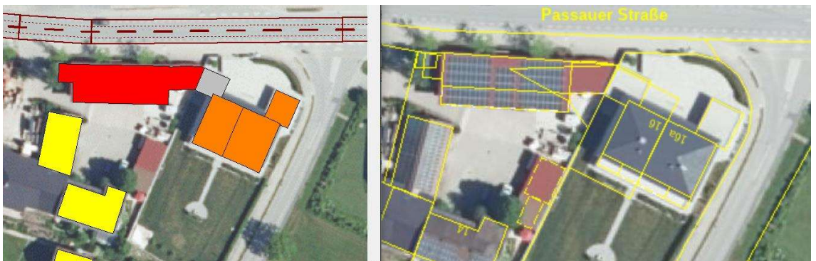
Abbildung 6. Darstellung der betroffenen Gebäude für den Bereich Passauer Straße 14, Aiterhofen.