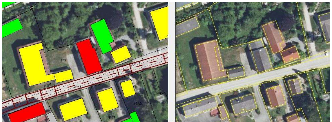
Abbildung 9. Darstellung der betroffenen potenziellen Außenwohnbereiche für den Bereich Lindenstraße 10.

S:\MIP\Proj\175\M175459\M175459_07_Ber_2D.DOCX:16. 02. 2024