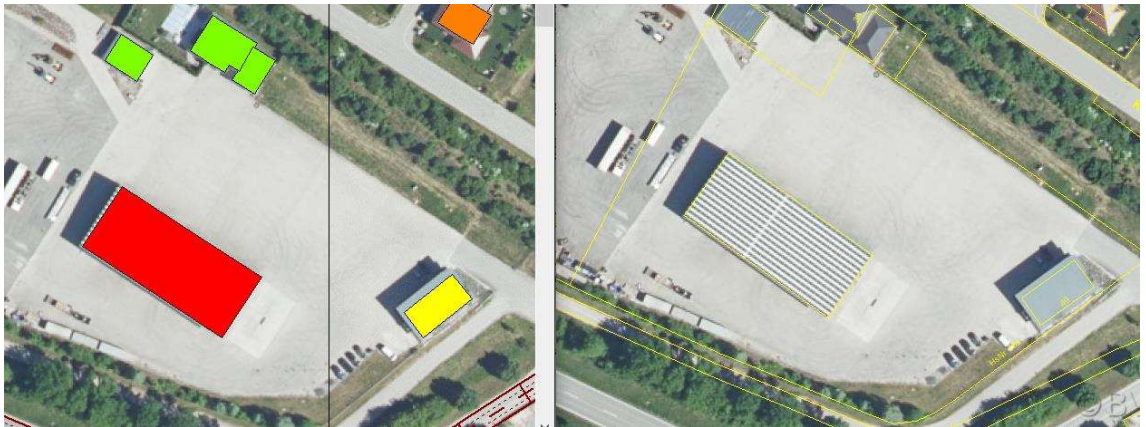
Abbildung 5. Darstellung der betroffenen Gebäude für den Bereich Obere Dorfstraße 38/40/40a, Aiterhofen.