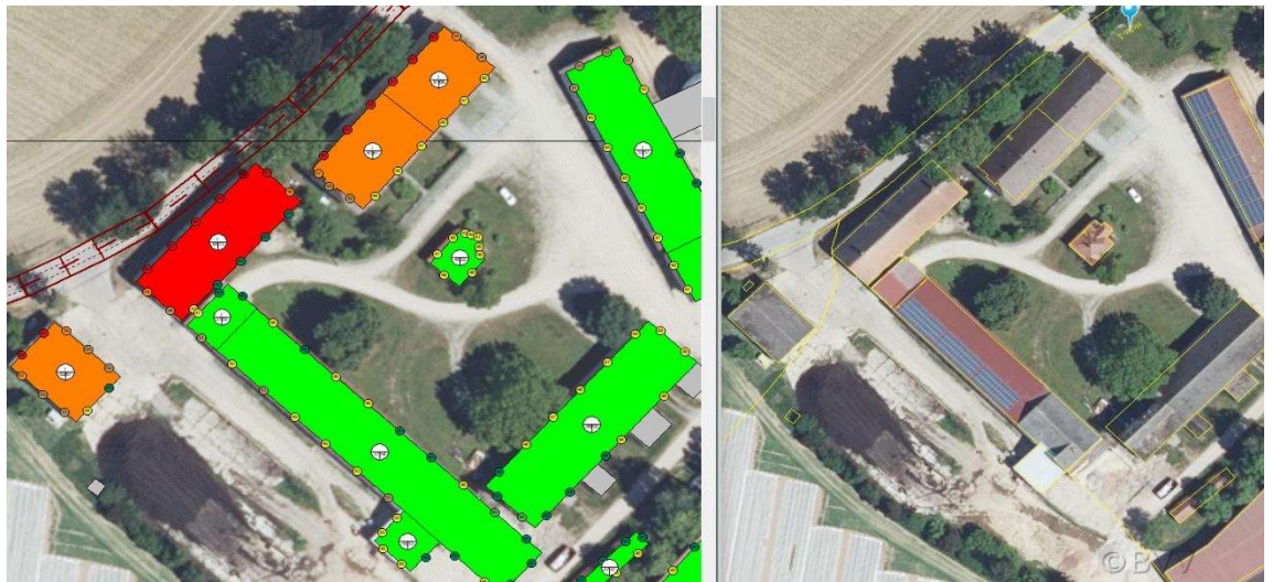
Abbildung 11. Darstellung der betroffenen potenziellen Außenwohnbereiche für den Bereich Makofen 2.