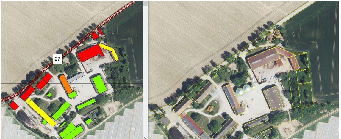
Abbildung 8. Darstellung der betroffenen Gebäude für den Bereich Makofen.