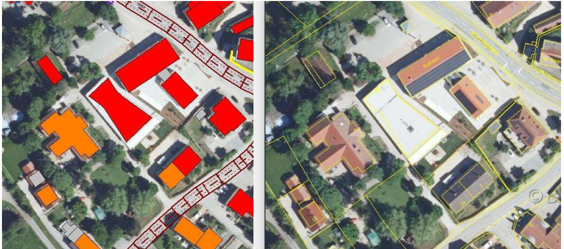
Abbildung 2. Darstellung der betroffenen Gebäude für den Bereich Kirchplatz 9/9a, Straßkirchen.