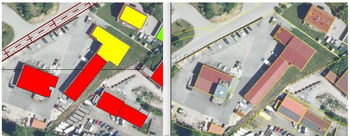
Abbildung 4. Darstellung der betroffenen Gebäude für den Bereich Obere Dorfstraße 34, Aiterhofen.